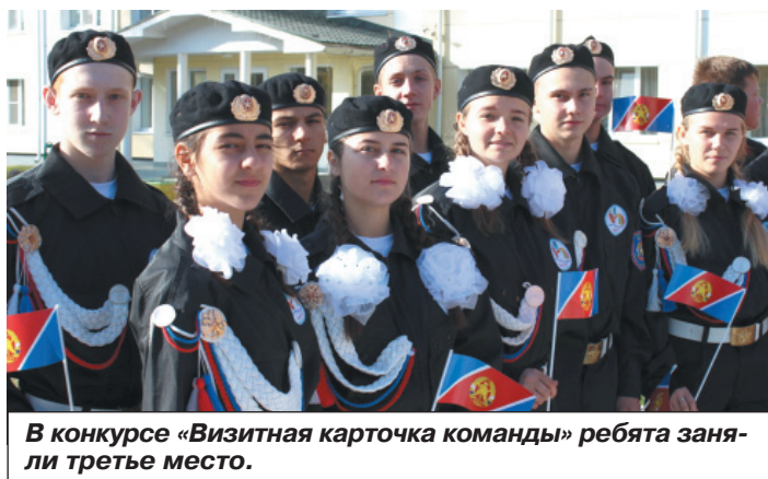
В конкурсе «Визитная карточка команды» ребята заняли третье место.

ло дело добровольного служения общественным интересам и активного участия граждан в государственных процессах на новый, более высокий уровень. Всероссийское детско-юношеское общественное движение «Юный пожарный» объединяет по всей стране именно таких молодых людей, которые хотят помогать своим сверстникам и младшим школьным товарищам, соседям и родителям предотвращать пожары, учить их жить безопасно, защищать себя от беды. Юные пожарные - молодое будущее поколение добровольцев и волонтеров, которым еще предстоит проявить себя в деле. В этом году задача развития и поддержки движения «Юный пожарный» Всероссийским добровольным пожарным обществом особенно актуальна и востребованна, оттого со стороны ВДПО особое внимание конкурсу и конкурсантам.