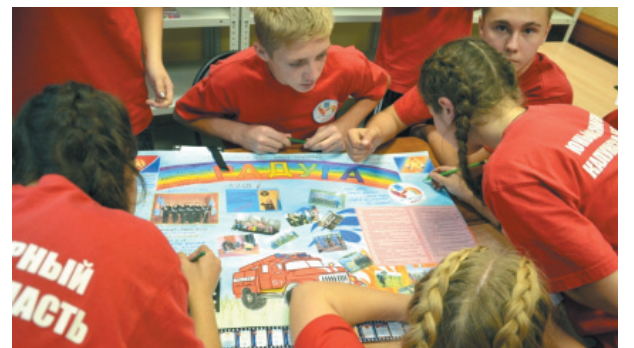
В конкурсе стенгазет 1-е место заняла ДЮП «Радуга» Калужской области.