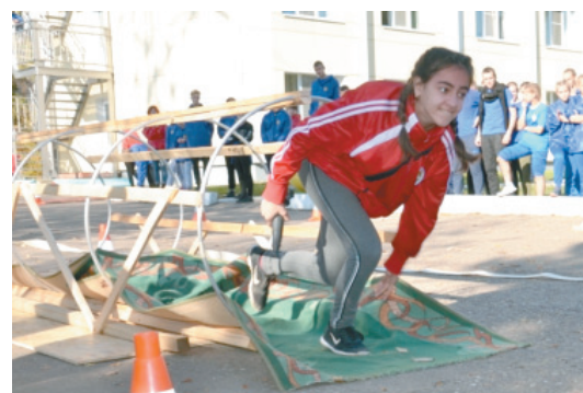
В соревнованиях по программе СТФ ДЮП «Радуга» заняла первое место.

рий Эл, Ростовской, Ленинградской, Челябинской областей, Алтайского и Приморского краев. Центральным регионом представили команды из Московской и Калужской областей. Смотр-конкурс «Лучшая дружина юных пожарных России» проводится ежегодно. Организатором выступает Всероссийское добровольное пожарное общество при поддержке МЧС России и Министерства образования и науки Российской Федерации.